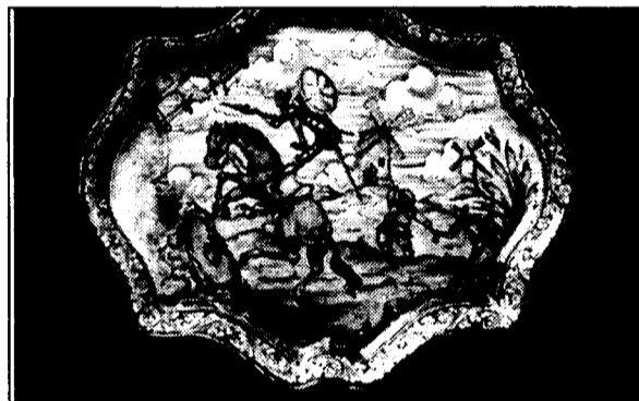
En las imágenes superiores, dos de los trabajos que realiza Germán Rodríguez en diferentes estilos.