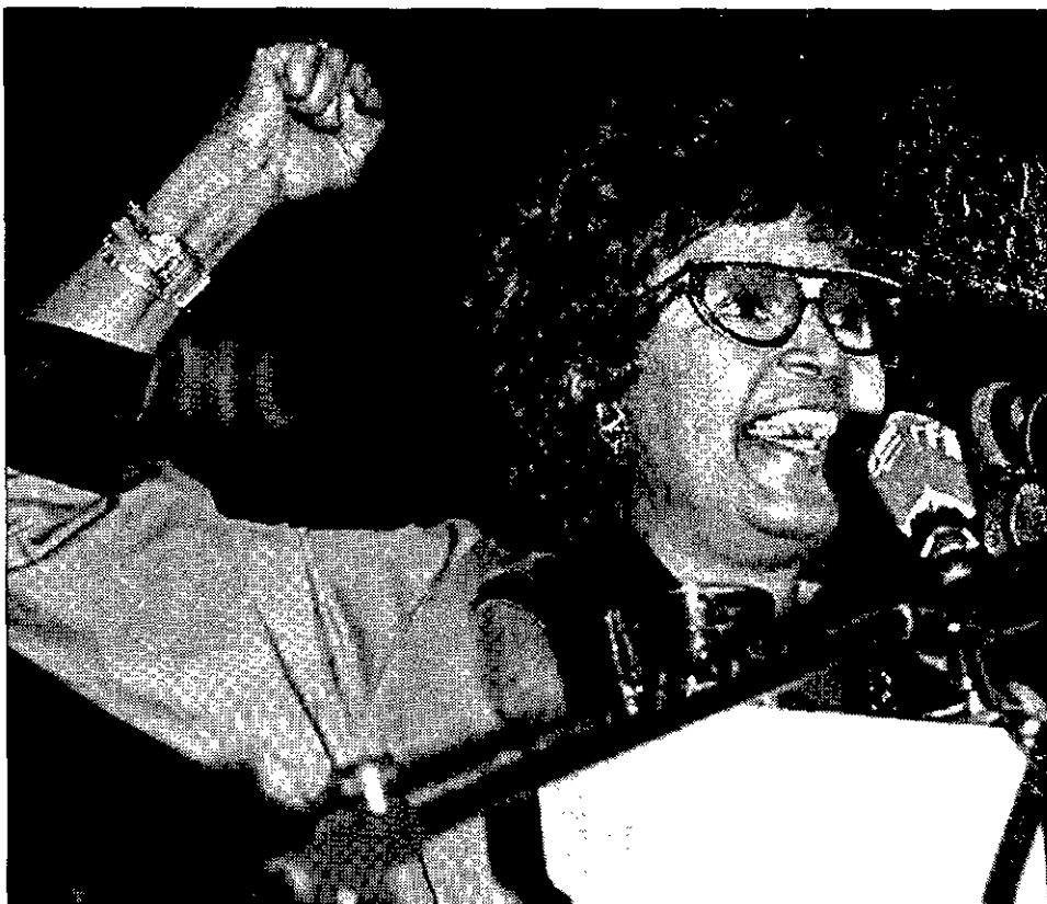
MUY POPULAR Winnie, en una conferencia del Congreso Nacional Africano, en Johannesburgo, en abril pasado.