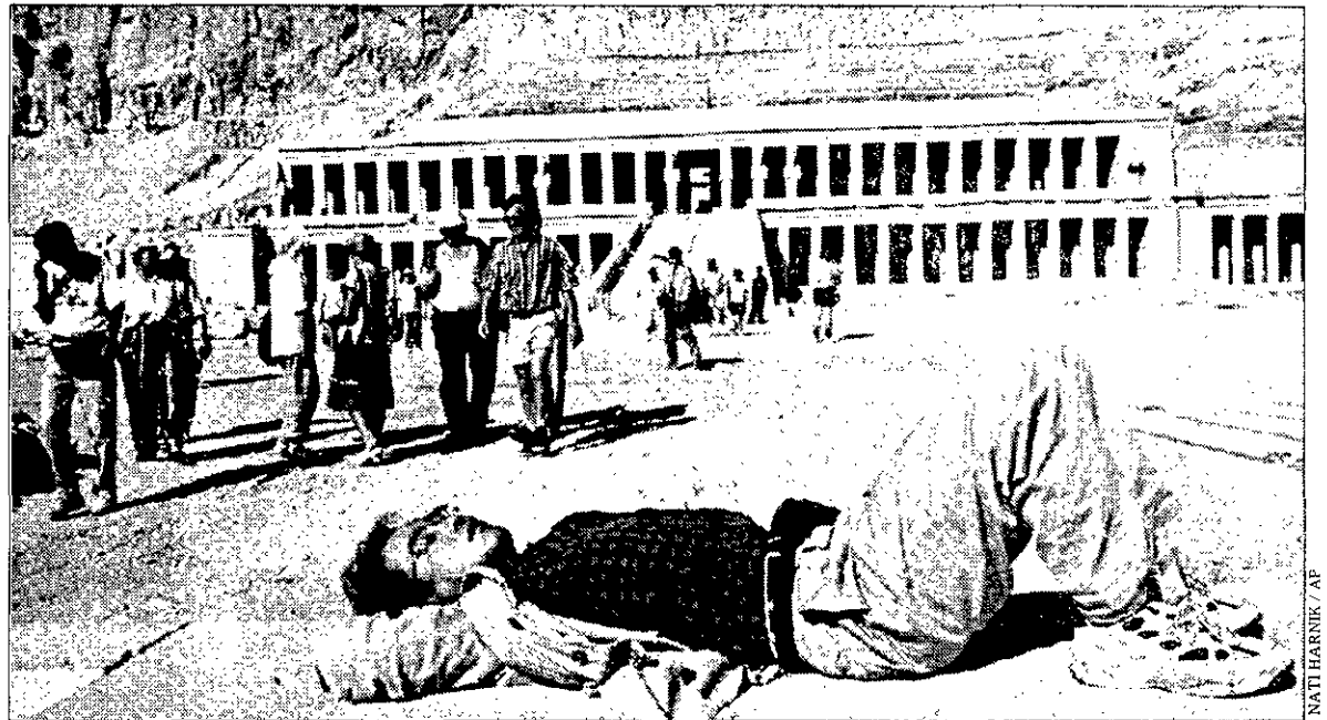
SIESTA PELIGROSA Un turista japonés se sienta en el lugar de la matanza, en Luxor, 24 horas después del suceso.

EE UU, contrarios a todo levantamiento de las sanciones económicas a Bagdad, y Rusia, que se ha comprometido a impulsar el fin del embargo. Washington ya ha reafirmado que utilizará su derecho de veto en la ONU, un obstáculo insalvable para la sonriente diplomacia rusa y un retorno al punto de partida.