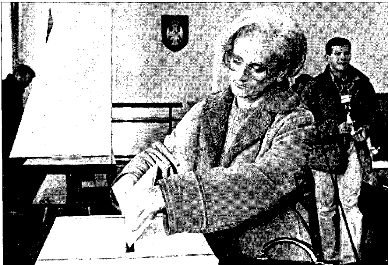
AVOTAR Una serbobosnia introduce su papeleta, ayer, en Pale, durante la primera jornada electoral.

Un independiente, el diputado Ahmed Taha, se preguntó “¿quién tiene interés en actuar contra Egipto actualmente?”, antes de señalar que “un grupo de turistas israelíes anuló su visita al lugar del atentado sólo una hora antes de que se produjera”.