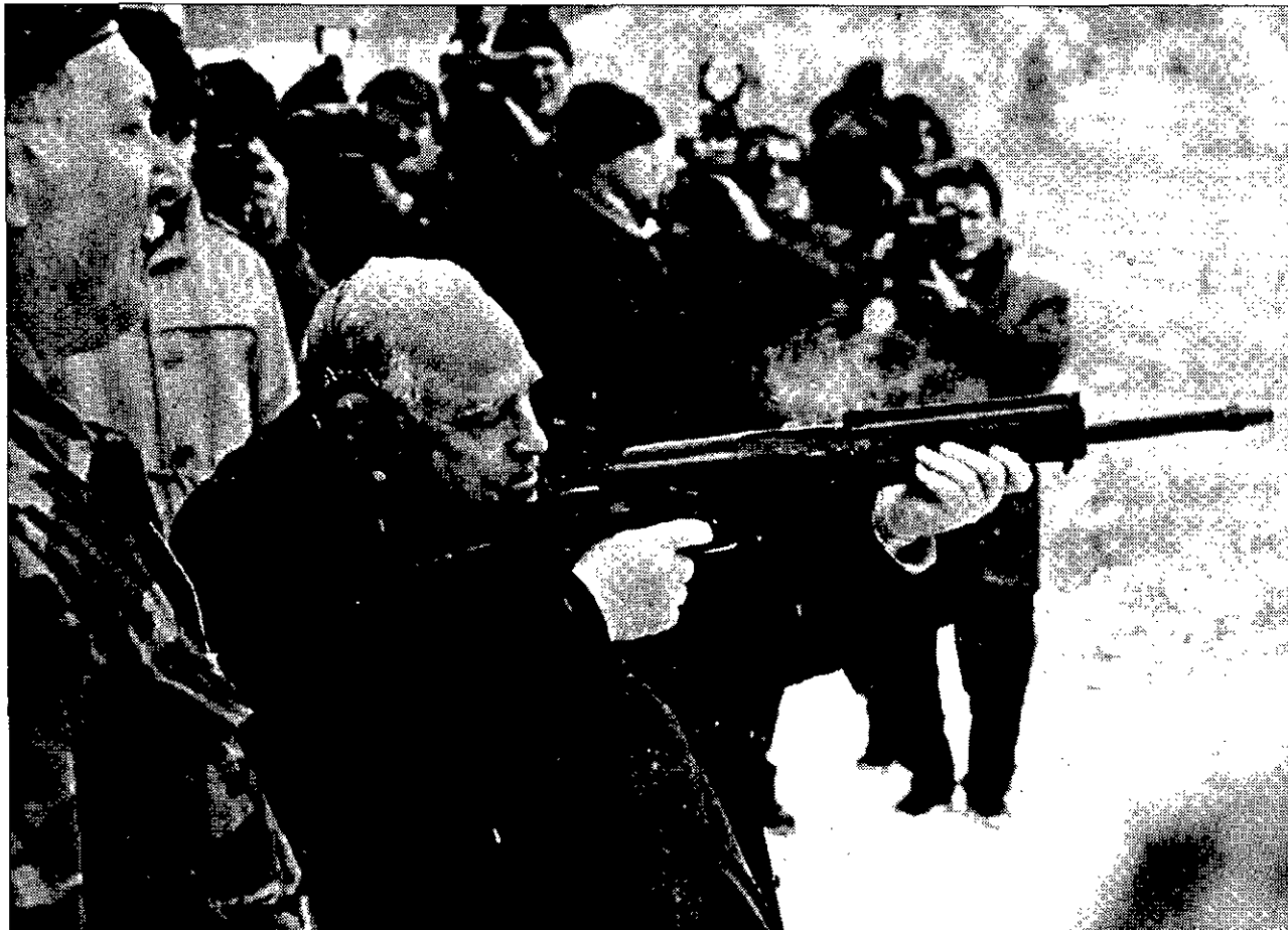
NUEVO MODELO DE KALASHNIKOV El primer ministro ruso, Víctor Chernomyrdin, prueba el último modelo del popular Kalashnikov.

Las fosas fueron descubiertas durante investigaciones de rutina tras las demandas de amnistía presentadas por ocho miembros de las fuerzas de policía que operaban en Messina. La Comisión está habilitada para conceder amnistía a cambio de una revelación de la verdad en los casos de crímenes políticos.