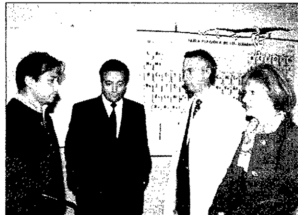
El Gobernador durante la visita a Mondéjar.

Mahou es una marca líder en el sector cervecero europeo y cuenta con otra factoría en Madrid. Fue fundada por Casimiro Mahou en 1890.