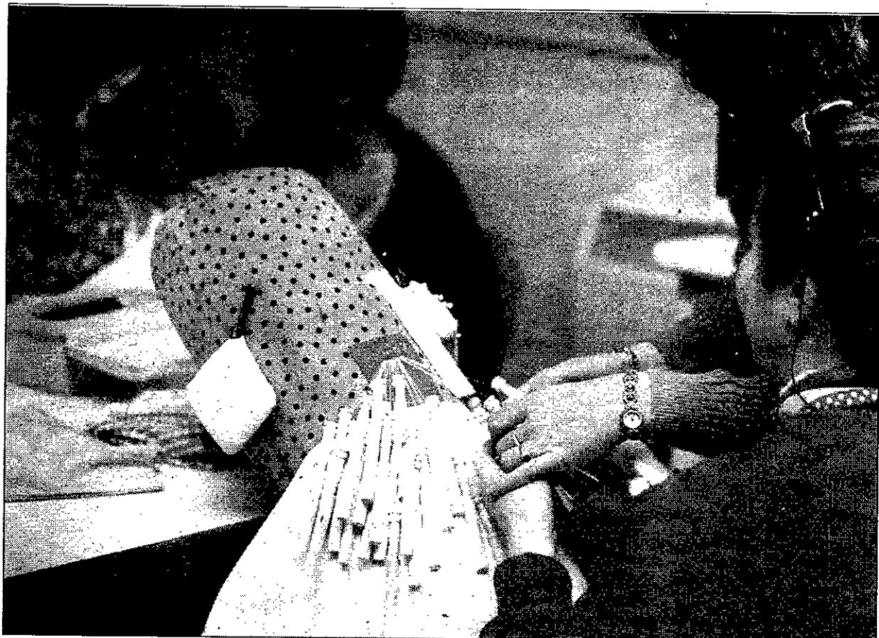
Encaje de bolillos, cestería o talleres de recuperación de música tradicional son algunas de las actividades.

Una selección de los trabajos presentados permanece expuesta al público desde el pasado lunes, en las dependencias de la Jefatura Provincial de Tráfico, en horario de 9 a 14 horas. Los dibujos ganadores del primer premio en cada categoría pasarán a la final para participar en los premios estatales.