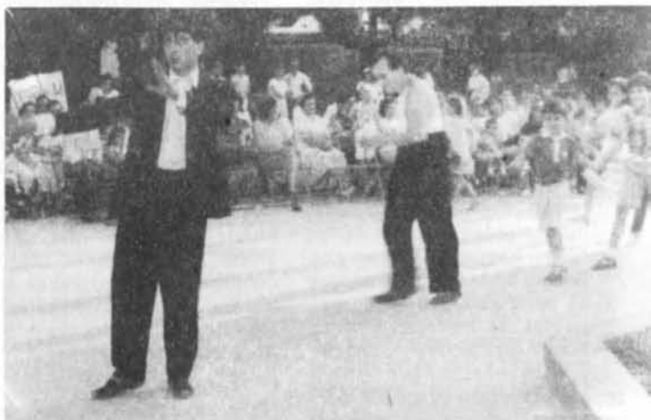
El Teatro del Gusarapo, en su actuación en el recinto del Parque de Gasset.