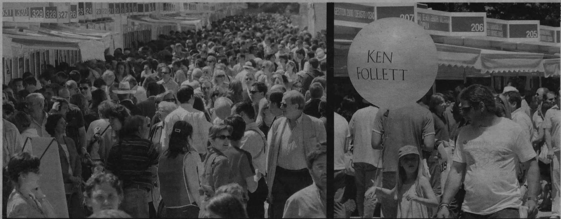
Ni la lluvia, al principio, ni el calor, al final, impidieron a miles de personas acudir a la Feria del Libro de Madrid. El escritor Ken Follett batió su propio récord firmando 2.050 ejemplares de su obra.