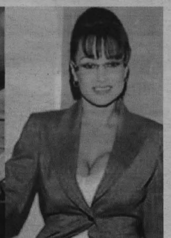
Sarah Palin, a la izquierda, estará interpretada por Lisa Ann, a la derecha, en la parodia pornográfica Nailin' Paylin .