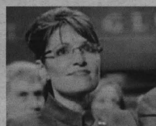
Sarah Palin reina en los programas americanos

Otra joya que se podrán ver en la cinta es la llegada de dos camioneros rusos borrachos que tocan a la puerta trasera de Paylin y... el res-