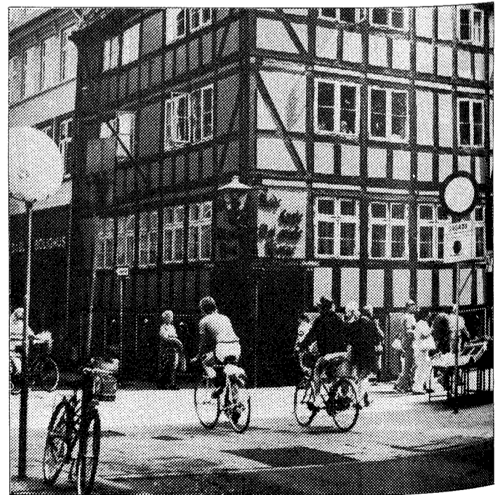
Aspecto de Copenhague, donde se está celebrando la «cumbre» de la CEE

En el terreno político, dado que la «cumbre se desarrolla a escasas fechas de la reunión de Washington entre Ronald Reagan y Mijail Gorbachov, es previsible que los dirigentes de los «doce» tomen una postura de apoyo a la misma.