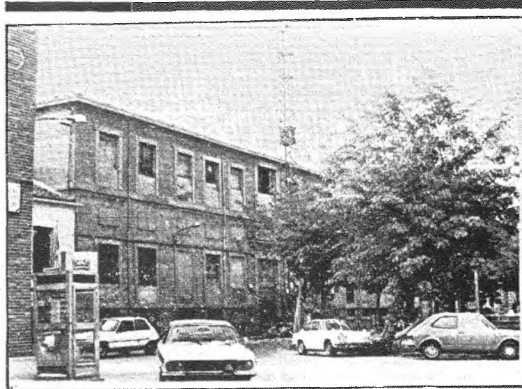
Ya han comenzado las obras de demolición de la cubierta del Hospital Municipal, que se encontraba en estado ruinoso, presentando peligrosidad para los transeúntes. Por el momento, sólo se desmontará la cubierta y, una vez efectuadas estas obras, se va a proceder a la reparación definitiva del Hospital, tras los estudios técnicos correspondientes, que ya podrán ofrecer los datos suficientes para ver la situación real de deterioro en que se encuentra este edificio sito en la plaza del Pan. El presupuesto de esta primera fase de las obras está tasado en un millón doscientas cuarenta y dos mil pesetas. Aunque todavía no se ha visto realmente cuales son las partes dañadas y en estado de ruina, en un primer informe realizado por el aparejador municipal, se dio a conocer la existencia de desplazamientos en los muros y en la cornisa por el hundimiento de la cubierta. El tema fue tratado en dos permanentes del pasado mes de julio con carácter urgente, a instancias del concejal José María Tapia por la peligrosidad que pudiera suponer para los viandantes.

más representaciones. "Nosotros por nuestra parte seguiremos ahondando en la cultura autóctona de Talavera, queremos que el pueblo sepa cual es su auténtica raíz, como es la tierra donde ha nacido, en fin queremos que tenga una buena base de identificación" apuntilla el Director del Teatro Libre de Talavera.