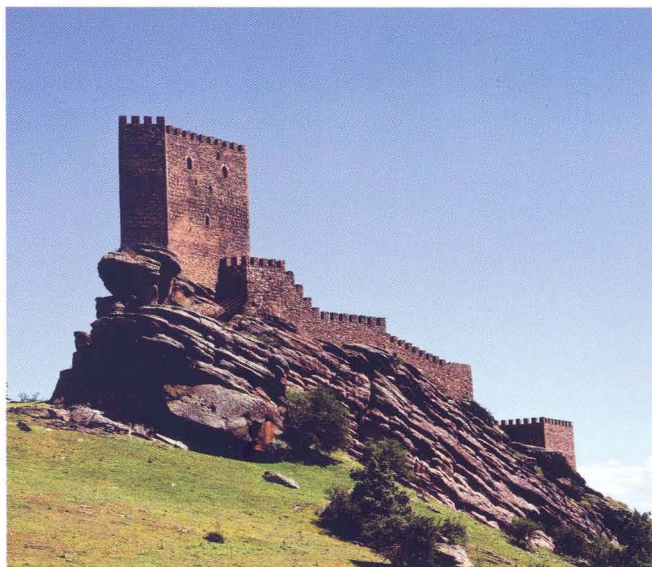
Castillo de Zafra

- Empezamos nuestro recorrido por el castillo de Zafra, situado entre los pueblos de Campillo de Dueñas y Hombrados. Está situado sobre una gran roca lo que le hacía prácticamente inexpugnable. De propiedad privada, por lo que visitarlo por dentro es complicado. Es quizás el castillo más llamativo de Guadalajara.