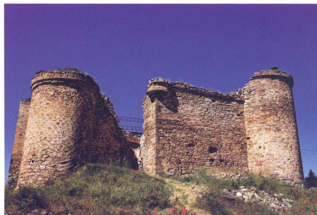
Castillo de Estables

- Nos vamos ahora al castillo de Estables situado en el pueblo del mismo nombre. También llamado "de la mala sombra" debido a que su constructor empleó la violencia y el engaño para llevar a cabo las obras. Se encuentra en