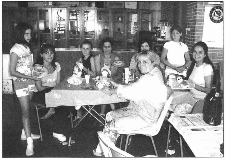
Taller de pintura en el Centro Social

En el Cristo, a pesar de que hacía buen día, no hubo mucha gente en la dehesilla; aunque el monte bajo estaba achicharrado, los robles altos