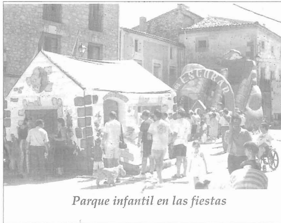
Parque infantil en las fiestas