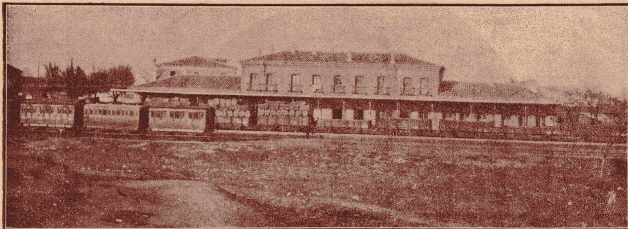
Vista de la Estación férrea de Ciudad-Real, donde recientemente se han introducido grandes reformas, entre ellas el alumbrado por fluido eléctrico y nuevos pabellones para la mejor instalación de los servicios.