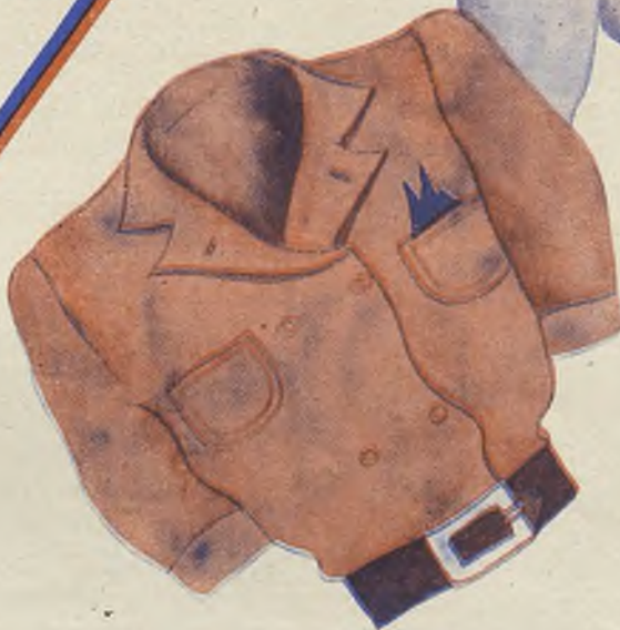
la blusa camisera