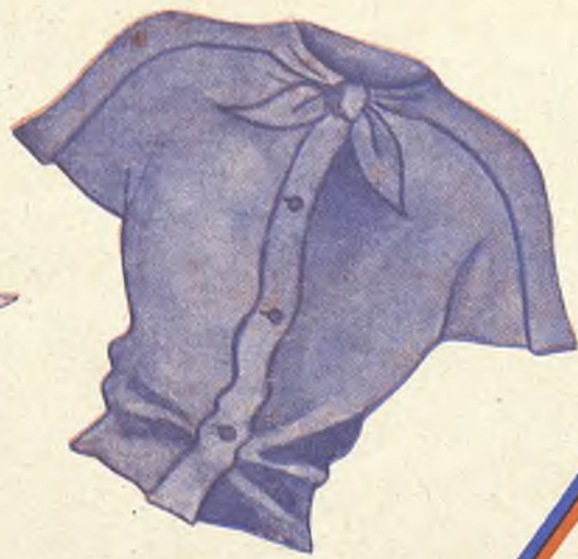
la blusa lisa