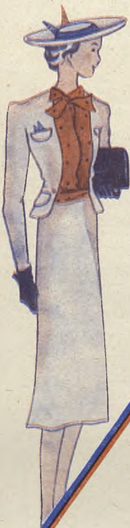
el traje blanco