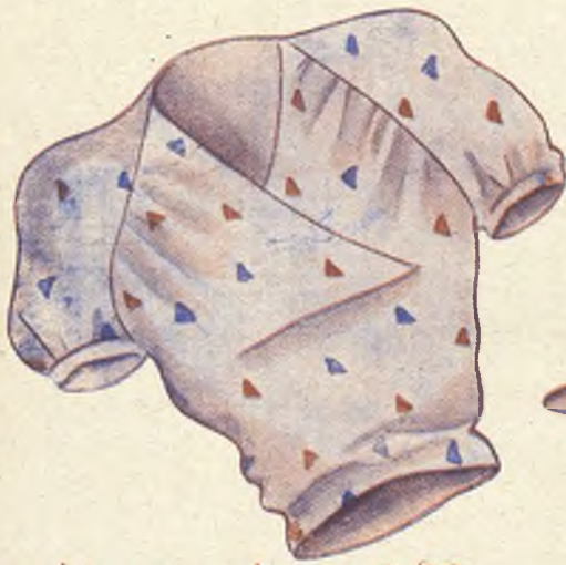
la blusa estampada