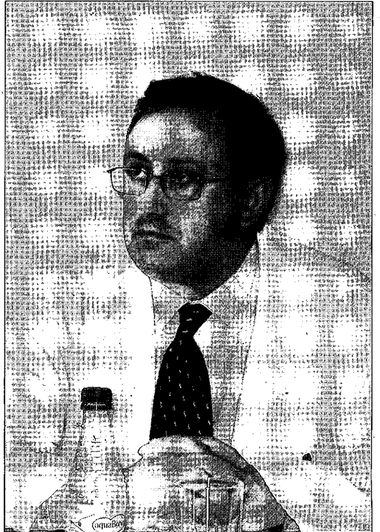
Cañizares, el día de su toma de posesión.

GALARDÓN. La marcha de Agustín Cañizares ha salido a la luz el mismo día en el que el hospital Santa Bárbara ha sido designado como uno de los veinte mejores hospitales de España, según la lista elaborada por la empresa de servicios de información sanitaria Iasist. El complejo sanitario puertollanero ha sido galardonada como el mejor hospital general mediano en lo que a atención hospitalaria se refiere. Además, se ha reconocido al área de Cardiología