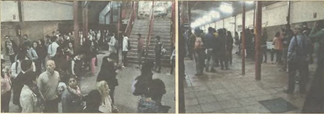
> Colas interminables a primera hora en la Estación de Autobuses para ir a Madrid.

Haznos llegar imágenes de aquellas situaciones o cuestiones que quieras denunciar públicamente y nosotros intentaremos recogerlas en esta sección ( redaccion@lacalle.info ):