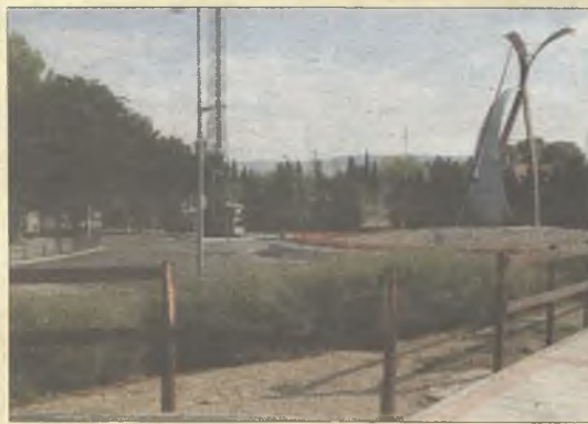
> Abandono del parque de Las Lanzas.