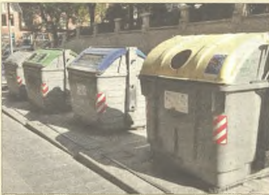
> Contenedores ¿soterrados? en La Carrera .