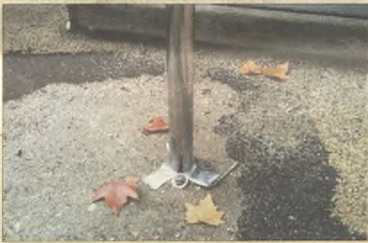
> Juegos infantiles inseguros y mobiliario deteriorado en zona Bulevar del Alto Tajo.