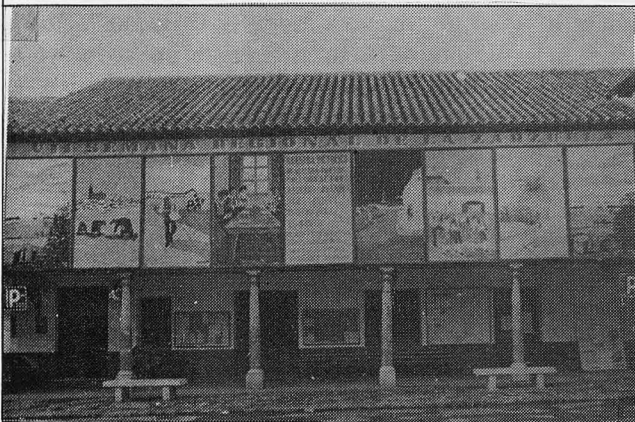
Paneles en la Plaza Mayor