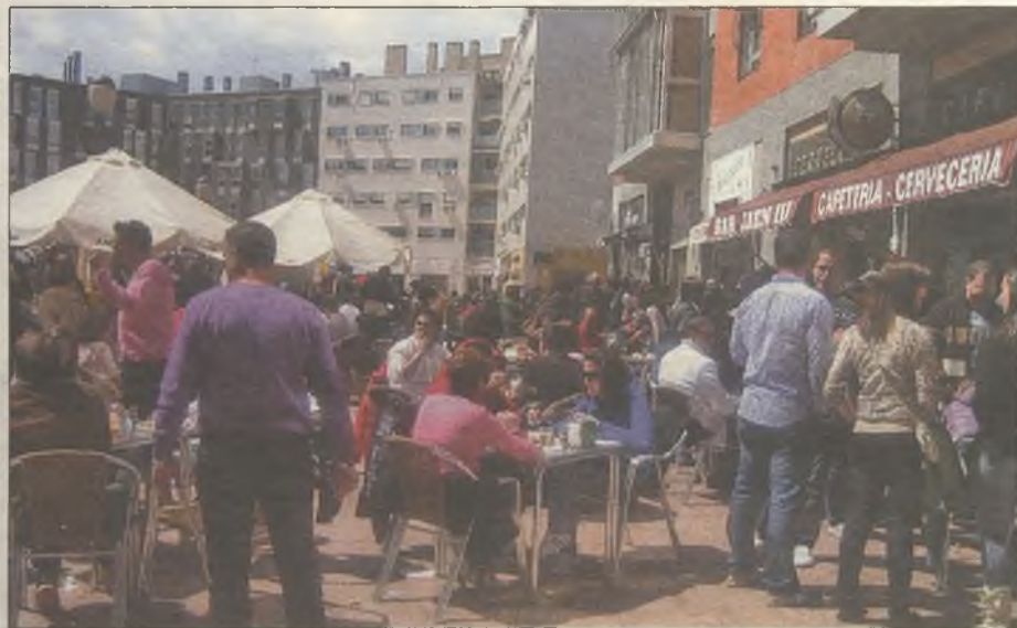
EN LOS BARES. El Barrio del Puerto se llenó durante la ruta

■ La II Ruta de las tapas organizada por la Asociación de Comerciantes y Empresarios del Barrio del Puerto fue un "auténtico éxito", según el Ayuntamiento. Durante el fin de semana se consumieron 28.900 tapas, frente a las 16.000 que se repartieron en la edición del año pasado. El premio al mejor bocado fue para Camino de Santiago de la Marisquería el Puerto.