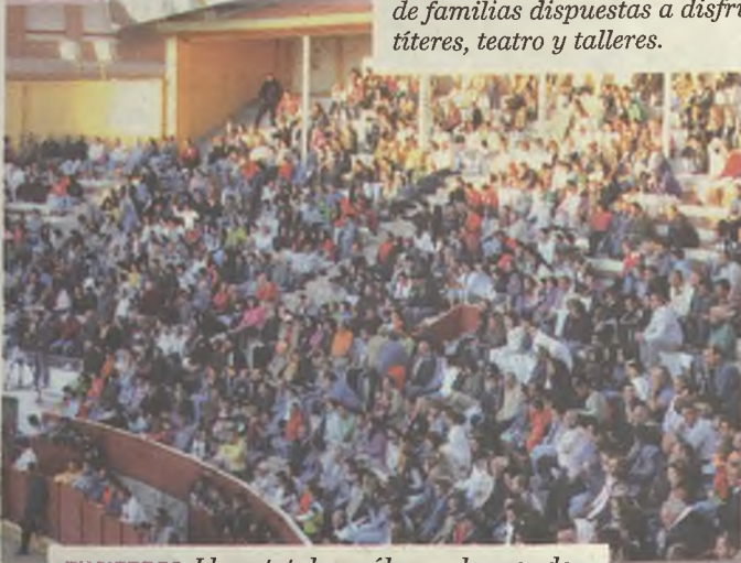
ENCIERROS. Lleno total no sólo en algunos de los conciertos, también durante los encierros de Guadalajara. Éste era el aspecto que registró la Plaza a primera hora de la mañana.