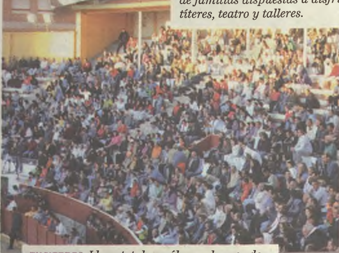
ENCIERROS. Lleno total no sólo en algunos de los conciertos, también durante los encierros de Guadalajara. Éste era el aspecto que registró la Plaza a primera hora de la mañana.