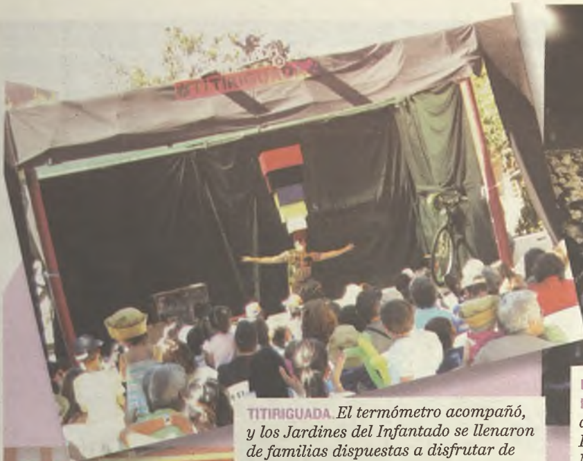
TITIRIGUADA. El termómetro acompañó, y los Jardines del Infantado se llenaron de familias dispuestas a disfrutar de títeres, teatro y talleres.