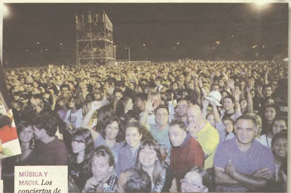
MÚSICA Y MAGIA. Los conciertos de Fuente de la Niña fueron todo un éxito de afluencia de público (arriba a la dcha.) La concentración de magos también dejó boquiabierto a más de uno (dcha.)