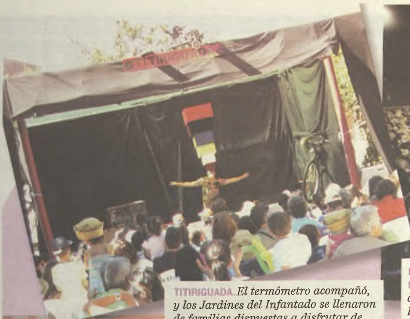
TITIRIGUADA. El termómetro acompañó, y los Jardines del Infantado se llenaron de familias dispuestas a disfrutar de títeres, teatro y talleres.