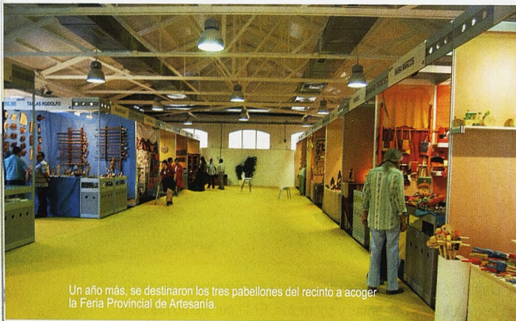
Un año más, se destinaron los tres pabellones del recinto a acoger la Feria Provincial de Artesanía.

Una actividad que, como indicó el consejero, también está ligada al turismo, sobre todo, al turismo rural. De ahí que exista un proyecto de colaboración entre esta nueva Consejería y los grupos de acción local y desarrollo rural para relacionar ambos sectores, de modo que se puedan trazar rutas para conocer los talleres de los artesanos de la región, ligándolos a las localidades donde se ubican y a los alojamientos allí asentados.