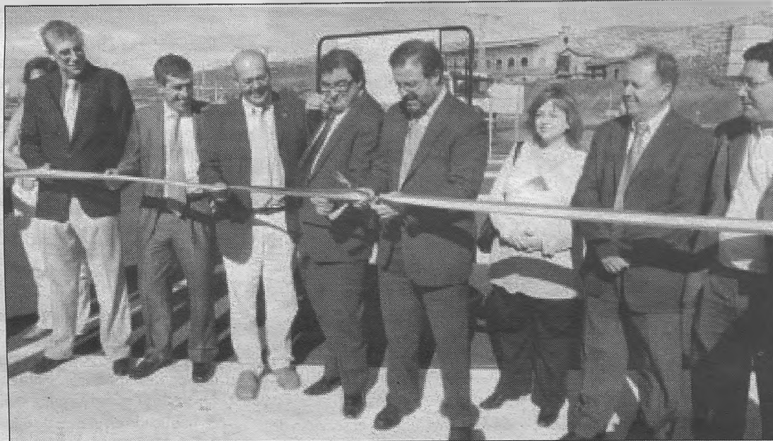
El presidente de la Diputación, acompañado de autoridades provinciales y locales, durante la inauguración de la segunda fase de la variante sur de Puertollano.

donde se trasladó en pasadas fechas para inaugurar el segundo tramo de la variante-sur, una actuación que contribuirá a evitar el transporte de mercancías pesadas y peligrosas por el casco urbano.