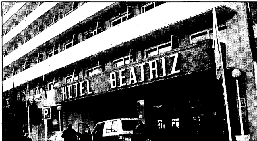
El Hotel Beatriz recibió recientemente el certificado de calidad.