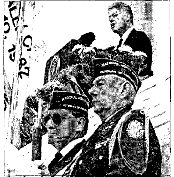
CON LOS VETERANOS Bill Clinton, ayer en Arlington.

Las elecciones preliminares o "primarias", al estilo de los Estados Unidos, fueron impuestas hace pocos años en el Partido Laborista (PL), y antes de los últimos comicios nacionales del 29 de mayo de 1996, que ganó Netanyahu, por el Likud.