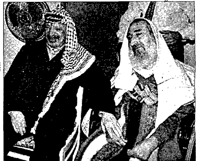
REUNIÓN Arafat y el fundador de Hamás, ayer en Gaza.

Washington.—El presidente norteamericano, Bill Clinton, y su vicepresidente, Al Gore, fueron interrogados el pasado martes por separado por el ministerio de Justicia a causa de las llamadas telefónicas que efectuaron desde la Casa Blanca para recaudar los fondos de su campaña electoral de 1996, anunciaron ayer fuentes de la Casa Blanca. Clinton y Gore son objeto de investigaciones del departamento de Justicia para determinar si tales llamadas telefónicas habrían supuesto una violación de la ley de financiación. AFP