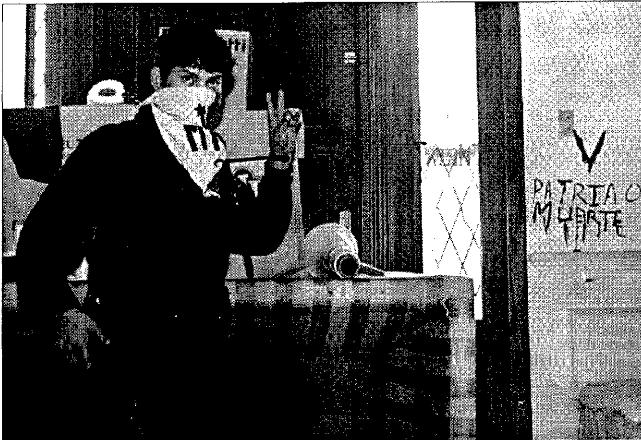
ANTES DEL ASALTO Uno de los guerrilleros de la MRTA en la embajada nipona de Lima antes del brutal asalto de los soldados de Fujimori.

I.V. —Todo lo contrario, nos consideramos fuertes, política e ideológicamente, somos revolucionarios, no somos como las fuerzas armadas, sanguinarios y terroristas brutales, no estamos acostumbrados como ellos a practicar la tortura ni a las ejecuciones extraoficiales, eso solo lo hacen quienes temen y se ocultan detrás de la fuerza, un revolucionario jamás puede descender al nivel de una genocida. Esa es la práctica de gente con baja catadura moral y ética, que para mantenerse en ese estado tienen que virtualmente drogarse con