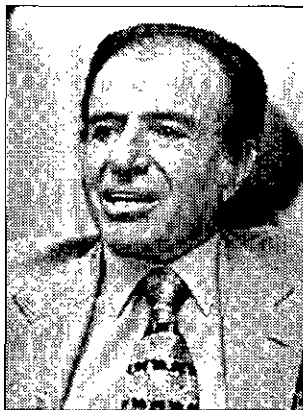
EL DERROTADO Carlos Menem.