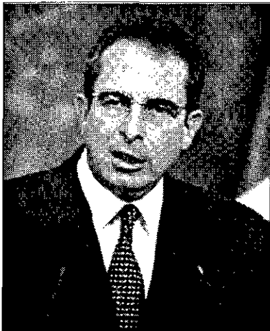
PREOCUPADO El presidente Ernesto Zedillo.

El presidente de Ecuador es el único que no acudirá a isla Margarita