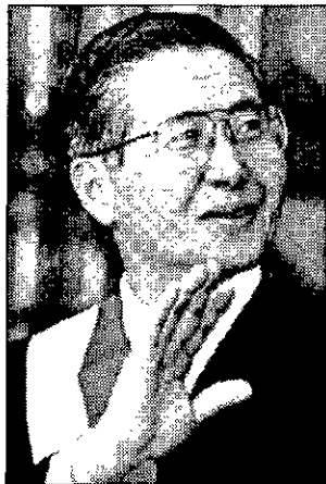
IMPOPULAR Alberto Fujimori.