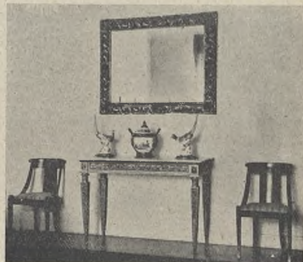
Esta mesa de pared Carlos IV porta unos preciosos objetos de porcelana; dos pájaros de colores subidos que prestan una nota alegre.

( D i b u j o s d e B u r g o s )