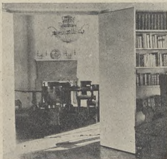
De la sala se pasa al comedor: sillas y mesas de caoba y lámpara central de estilo francés. La mesa es susceptible de varios tamaños; tiene por debajo el aspecto de dos veladores unidos.