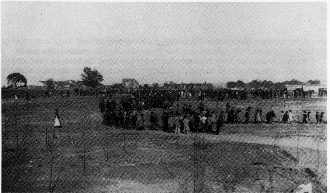
Parque de la Fiesta del árbol.