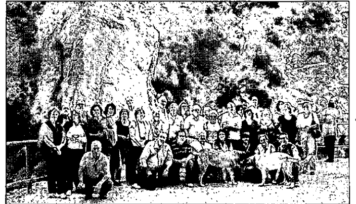
Participantes en la excursión a Segóbriga y las Hoces del Cabriel. / LT

En las Hoces del Cabriel, la expedición entró en contacto directo con la naturaleza en uno de los parajes naturales más bellos y sorprendentes de la región. Una visita también guiada que entusiasmó a los viajeros de la UP. Para completar la jornada, los participantes en este viaje tuvieron ocasión de degustar un delicioso almuerzo.