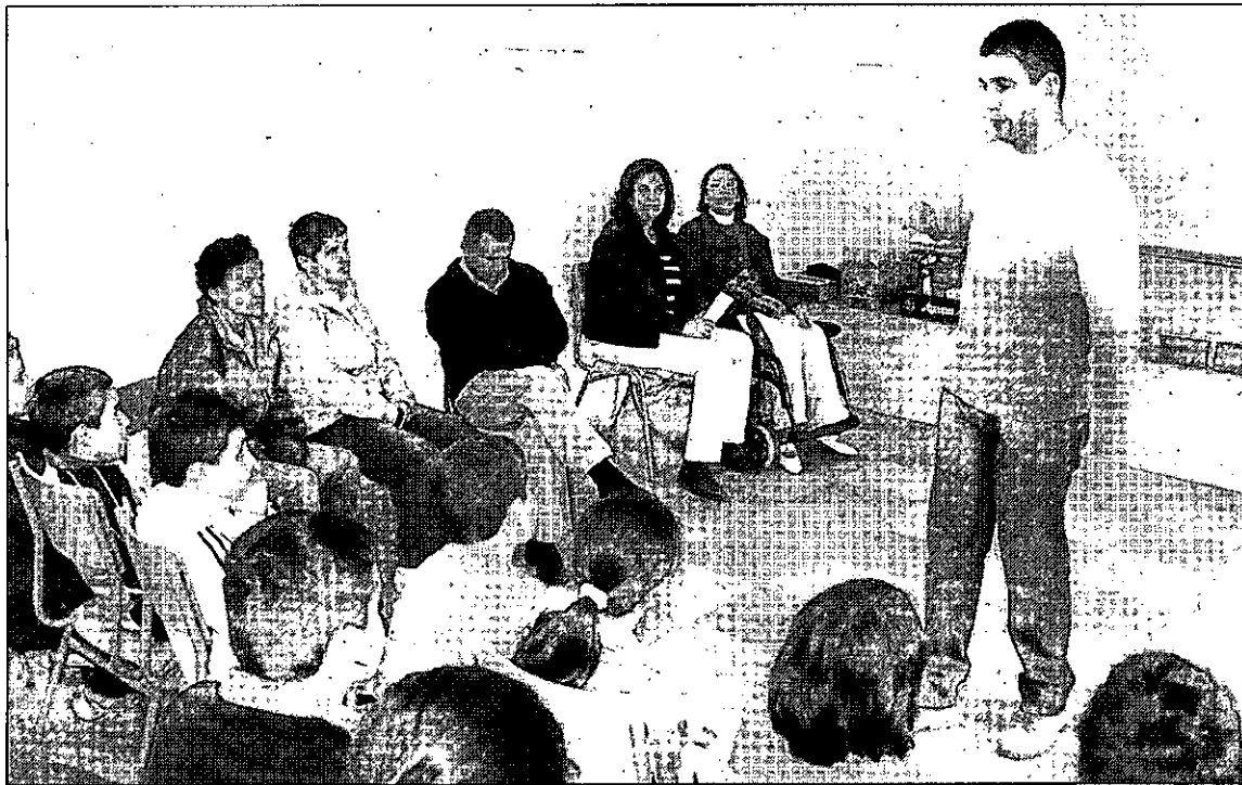
Los alumnos de Primaria, durante la jornada de intercambio en el centro Reina Sofía.