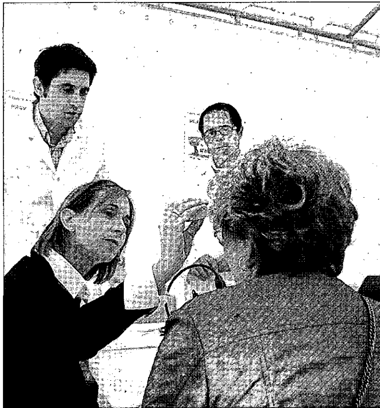
Una mujer se somete a la prueba de fototipo de piel.

«Lo esencial de estas jornadas es que los ciudadanos resuelvan sus dudas sobre la salud y como utilizar adecuadamente los medicamentos», indicó Juan Francisco Palomo, vocal de Colegio de Farmacéuticos de Ciudad Real. «De paso, todos los asistentes han conocido el fototipo de su piel, elasticidad, hidratación, etcétera, para un mejor cuidado, además de con-