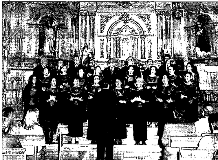
Una de las agrupaciones que participa en el programa de la Diputación.

pos participantes se fija en la cantidad total de 60.000 euros. La Diputación otorgará las actuaciones por riguroso orden de inscripción.