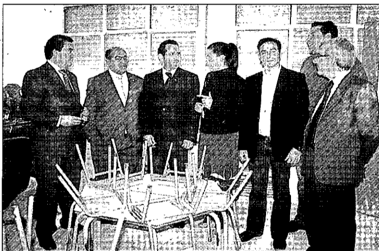
Antes de la clausura, hubo una breve visita.

ron a trabajar al sector de la construcción», señaló el delegado.