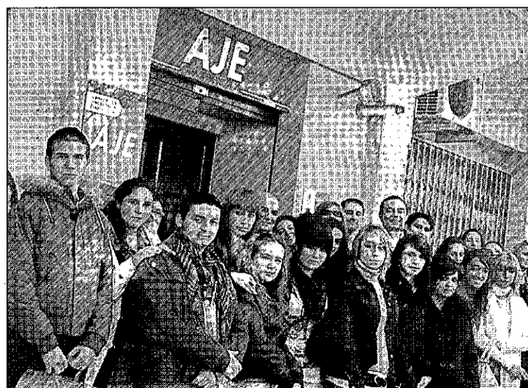
Los alumnos del colegio San José posan durante su visita a AJE.

Ambos ponentes coincidieron, desde sus diferentes perspectivas,