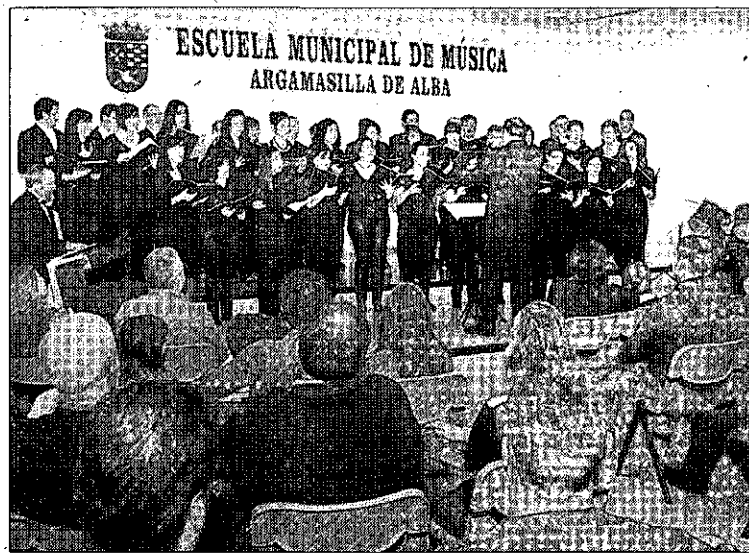
Concierto de Schola Cantorum en Argamasilla de Alba.

cuentro de Corales Villa de Argamasilla, que tendrá lugar en la iglesia parroquial, con la participación de la Coral Morales Nieva, de El Toboso, dirigida por Luis M. Morales; y la Coral Polifónica Cervantina, de Argamasilla de Alba.