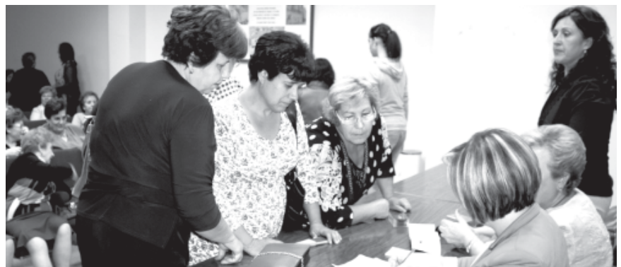
Curso de quesos en AMFAR; abajo, las afiliadas de AFAMMER se interesan por las actividades.

Por su parte, la asociación AFAMMER celebró una multitudinaria asamblea para anunciar las actividades previstas hasta final de año, donde destacan tres cursos, diversos viajes y un taller de teatro. Las propias afiliadas también hicieron propuestas y fue elegida una nueva vocal para la junta directiva. En el plano económico, la presidenta fue tajante al reconocer que “AFAMMER no tiene crisis”, argumentando que gracias a las aportaciones de las socias y a la venta de lotería, disponen de un colchón para afrontar el año.