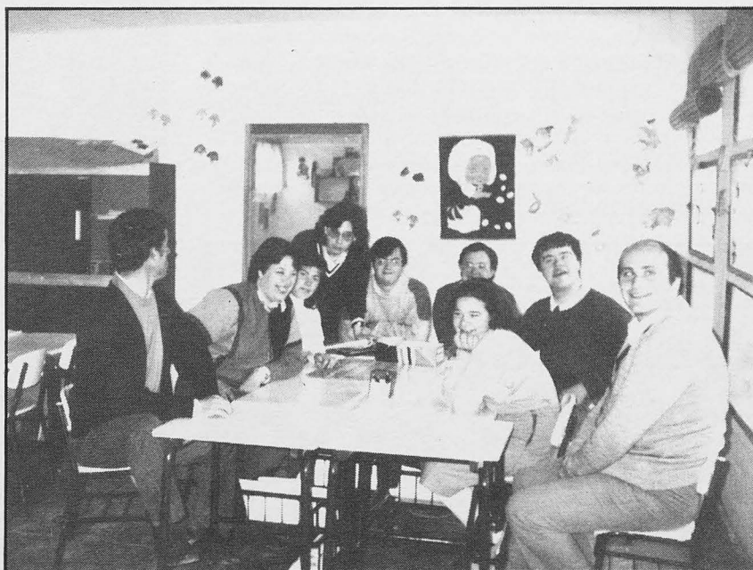
Grupo de colegio de minusválidos

Los niños del colegio «Virgen de Peñarroya», que así fue bautizado el centro, cuentan ya con talleres para su formación y realizan diversas actividades, tales como una Semana del Minusválido en la que incluso realizan representaciones teatrales.