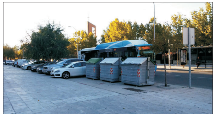
Esta parada de autobús en C. Alberche es inadecuada bajándose ante los contenedores.