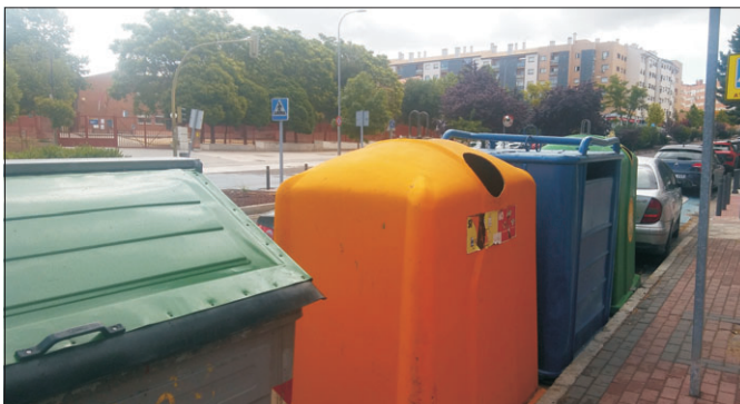
Contenedores inmediatamente antes de los pasos de peatones.