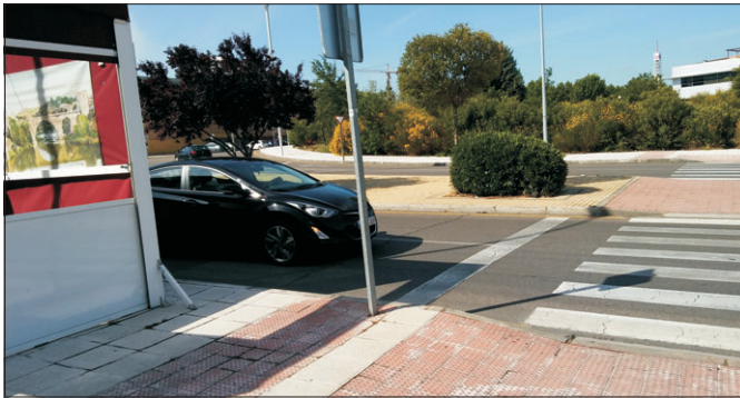
Marquesinas que quitan visibilidad en paso de peatones.