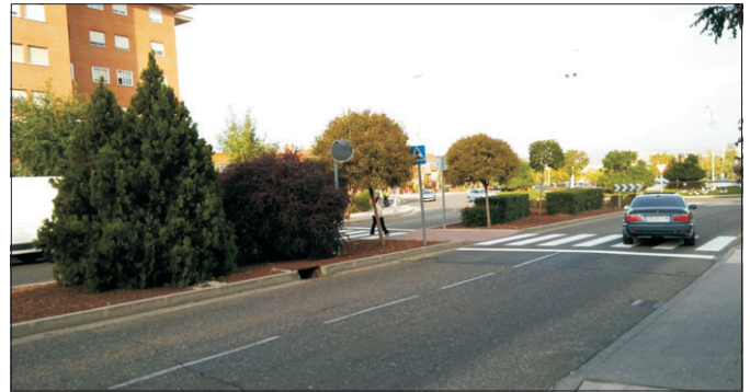
Los setos deben estar distanciados de los pasos de peatones.