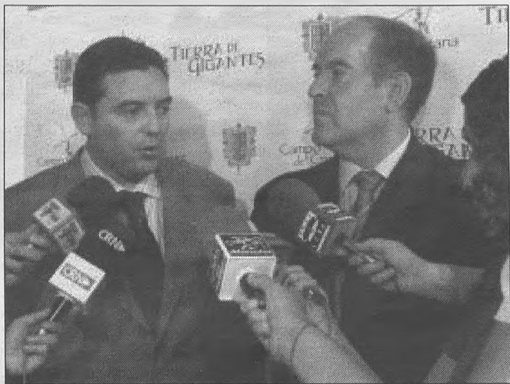
El alcalde de Campo de Criptana, Santiago Lucas-Torres, y el delegado provincial de Cultura, Ángel López, dieron a conocer el Plan Especial de Protección de la Sierra de los Molinos y del Albaicín, aprobado por la Comisión Provincial de Patrimonio.

El primer edil criptanense, quien agradeció la especial atención que ha tenido el delegado de Cultura con la localidad, señaló que el Ayuntamiento ya viene rea-