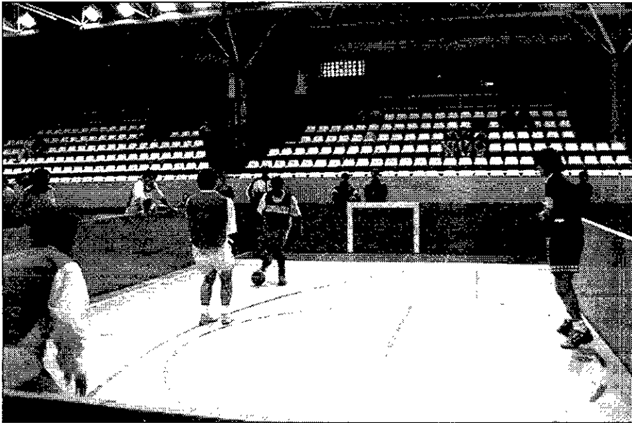
Ante todo, tener buen fondo físico: máxima para jugar a buen nivel en el minifútbol.