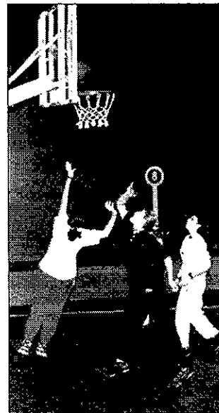
3x3 de baloncesto.

Más de 250 jugadores inscritos, un total de 70 equipos y muchos, muchos partidos son los datos de una competición que dejó como gana-