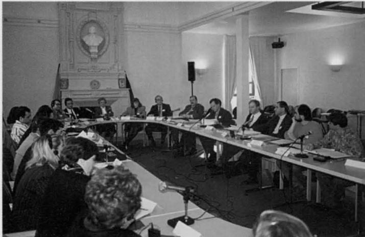
Las delegaciones de Puertollano y Pouzages compararon los problemas que afectan a los consumidores.

llanenses participaron en las sesiones de trabajo, que se enmarcan en el programa "Euromic", financiado por el gobierno de Castilla-La Mancha, y cuyo objetivo final es intercambiar experiencias y proteger de forma eficaz todos los derechos que asisten a los consumidores.