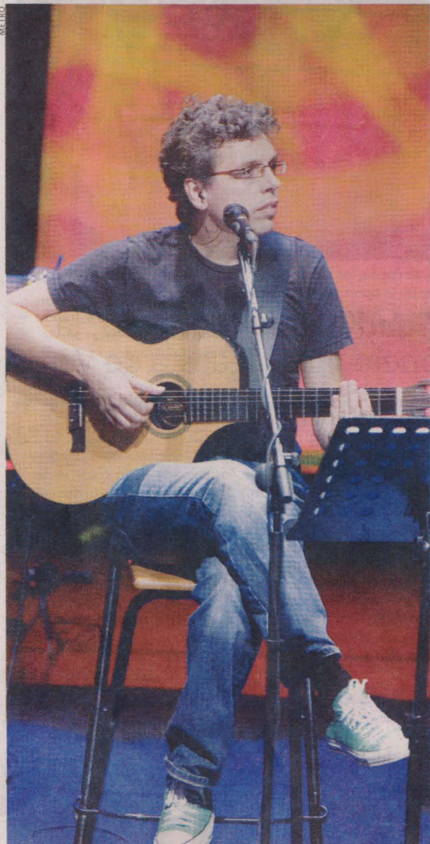
El cantante Pedro Guerra comenzó su andadura en solitario en 1995 con su primer disco Golosinas .

El cantante está de gira por los escenarios de Castilla-La Mancha