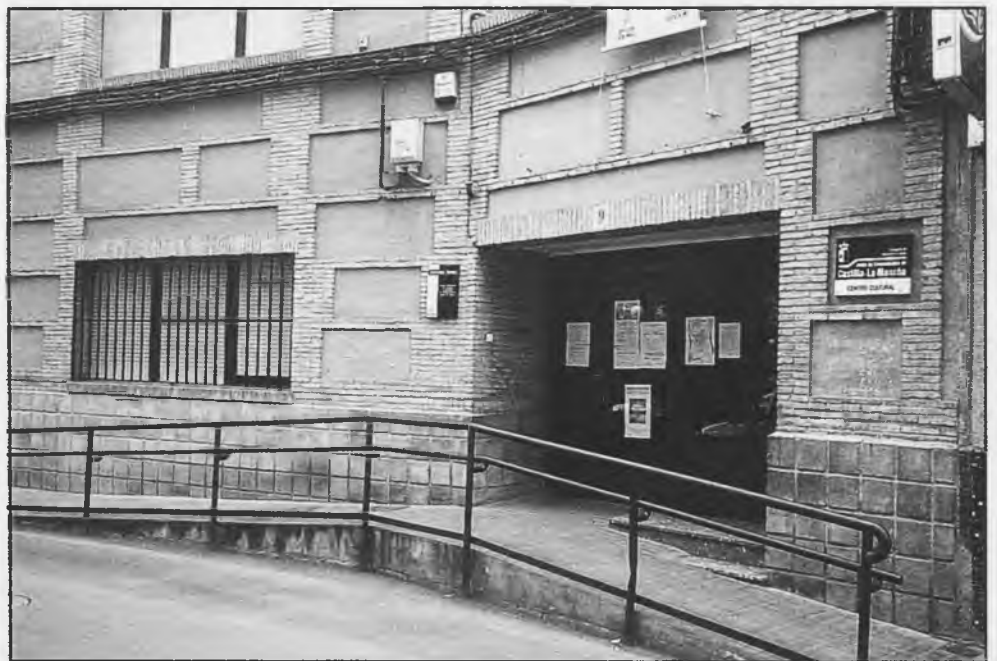
El pasado mes se inauguró una exposición de pinturas tailandesas en la Casa de Cultura