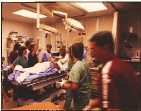
La OMC exige una respuesta global a los problemas de los médicos de Refuerzo

La Organización Médico Colegial ha aprobado el estudio realizado sobre la situación laboral del personal de refuerzo y que será remitido al Ministerio de Sanidad y a los representantes de las distintas Consejerías de Sanidad.