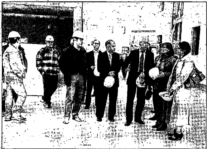
Autoridades de Alcázar acompañaron a la directora general de Vivienda.

En cuanto a las obras, se ha finalizado toda la estructura y se está empezando con los remates, aunque la empresa constructora todavía no encuentra prudente organizar una visita de los vecinos en grupo, porque todavía se manejan elementos pesados.