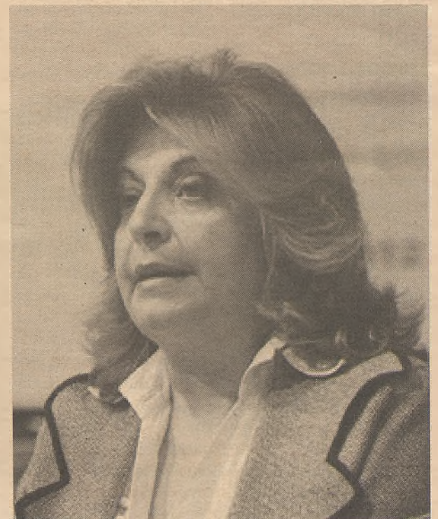
Imagen de la secretaria de empleo. Economía de Guadalajara

Según la secretaria de Estado de Empleo, la reforma laboral, la aprobación de la Ley de Estabilidad Presupuestaria y la reforma del sistema financiero ayudarán a construir un "nuevo modelo económico, mucho más moderno y más sólido en el que la industria podrá recuperar el papel que le corresponde".