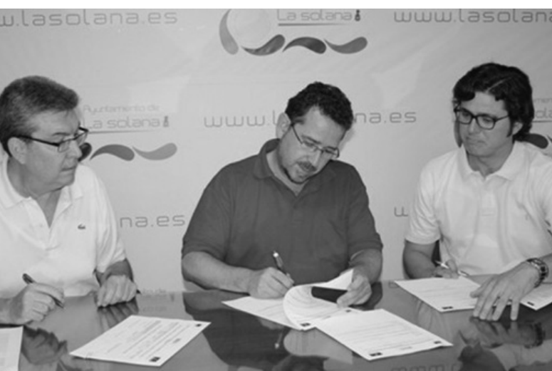
▲ Firma del convenio de prácticas

horas. El objetivo es facilitar al alumnado de cursos de formación para el empleo la realización de prácticas y conseguir una mejor cualificación por el contacto con el ambiente real de trabajo.*