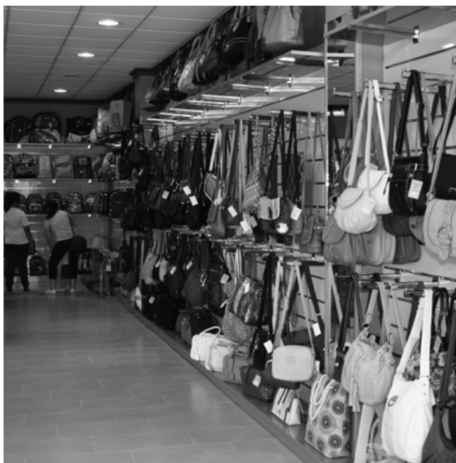
▲ Nueva tienda Outlet.