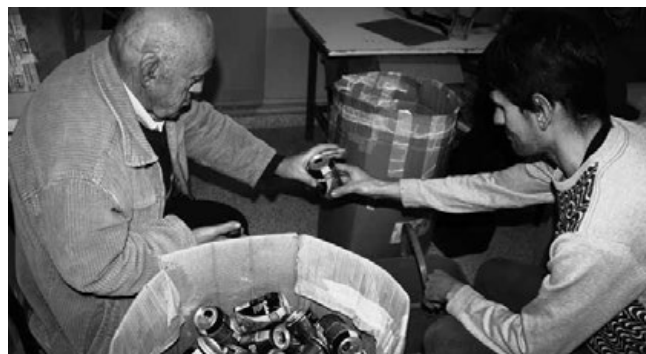
El Centro Ocupacional sigue comprometido con el reciclaje.