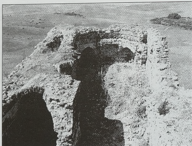
Vista del patio superior desde lo alto de la torre del Homenaje. Se aprecian las salas 6, 7, 8, 9 y 10

nal. El conjunto se asienta sobre un crestón rocoso de forma rectangular con orientación O-E, cuyas dimensiones máximas son de 51,50 m. de largo por 14,60 m. de ancho. La mayor parte los muros están elaborados en buena mampostería, aunque las esquinas de la Torre de Homenaje y de algunos puntos del exterior de la fortaleza presentan grandes sillares ligeramente almohadillados a modo de refuerzo. Por otro lado, utiliza ladrillos macizos para la construcción de arcos y bóvedas. También se constata el uso masivo de cal para mortero y enlucido de salas, aún conservado en parte. Presenta tres zonas bien diferenciadas: el patio E, por el que se accede al castillo; el patio O, con una cota de unos 4 m. por encima del anterior y en donde aparecen las estancias principales; y la Torre de Homenaje, un espacio independiente del resto situado en la parte más alta del crestón y que, por ende, presenta por sí solo unas perspectivas de defensa magníficas.